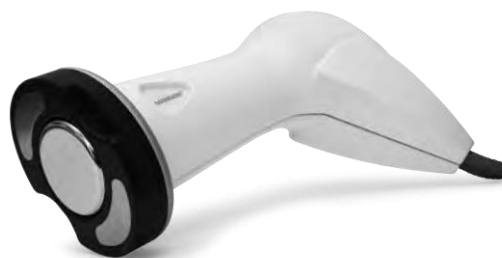
Sa ShockDual aplikatorom radi u sinergiji. U dvije verzije: veličine 80 i 60 mm.