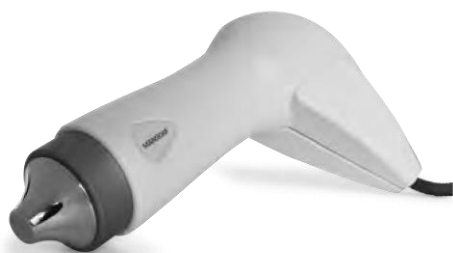
Sa ShockFocus aplikatorom indiciranim za izrazito ciljane tretmane.